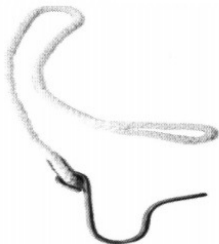
2. Podpinka pętlowa (węzowa)