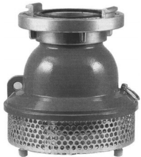
6. Smok ssawny prosty