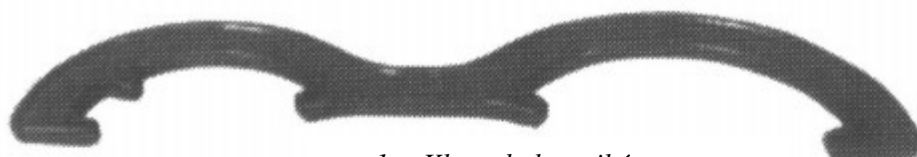
1. Klucz do łączników