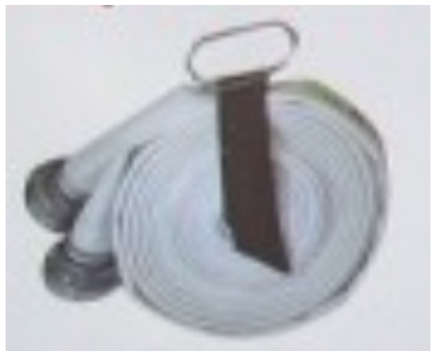
8. Wąż spięty noszakiem