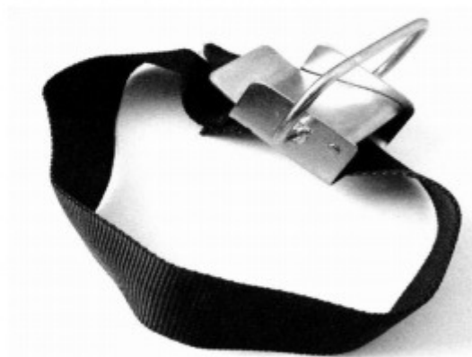
3. Noszak do węży